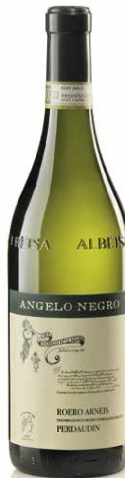
ROERO ARNEIS DOCG PERDAUDIN