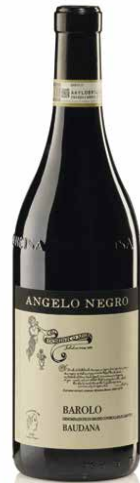
BAROLO DOCG BAUDANA 38 mesi tra botte e bottiglia 38 months between barrel and bottle