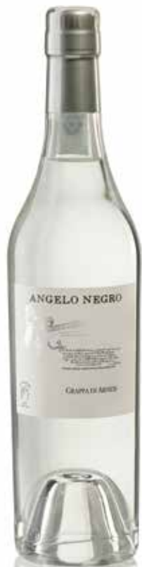
GRAPPA DI ARNEIS