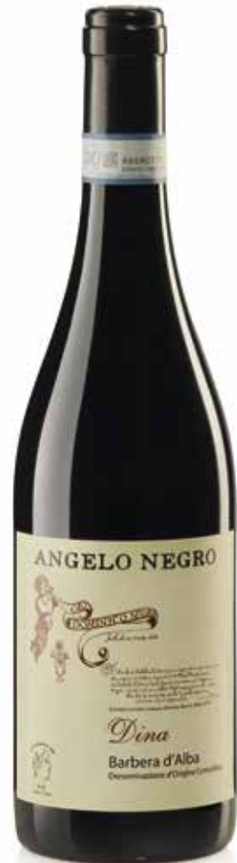
BARBERA D'ALBA DOC DINA