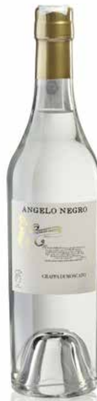
GRAPPA DI MOSCATO