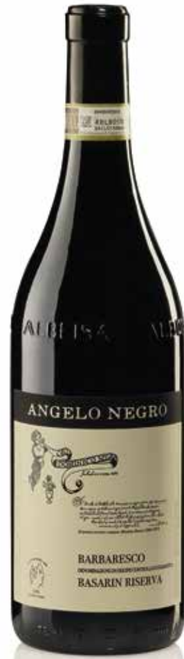
BARBARESCO DOCG BASARIN 26 mesi tra botte e bottiglia 26 months between barrel and bottle