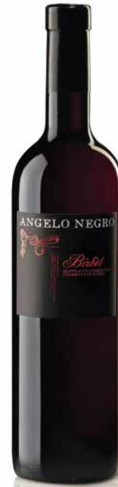
MOSTO PARZIALMENTE FERMENTATO BIRBÈT