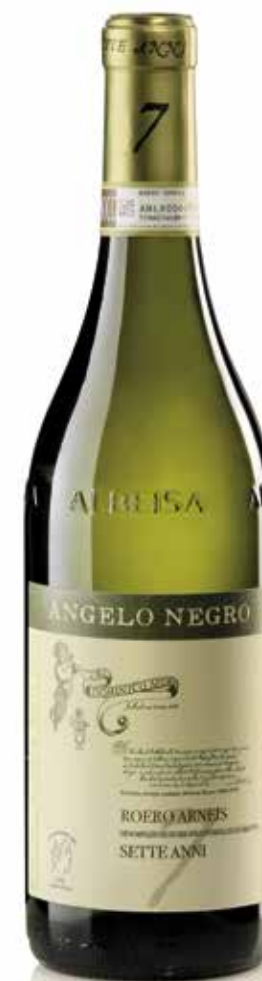
ROERO ARNEIS DOCG SETTE ANNI