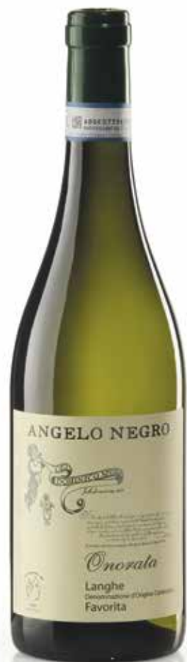
LANGHE DOC FAVORITA ONORATA