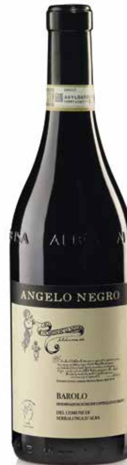
BAROLO DOCG DEL COMUNE DI SERRALUNGA D'ALBA 38 mesi tra botte e bottiglia 38 months between barrel and bottle