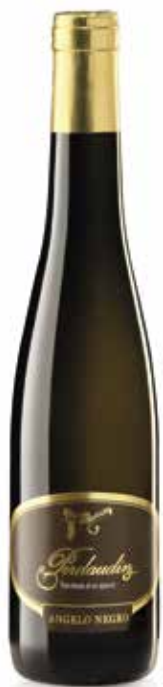
VINO OTTENUTO DA UVE APPASSITE PERDAUDIN