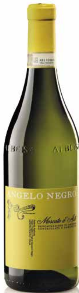
MOSCATO D'ASTI DOCG