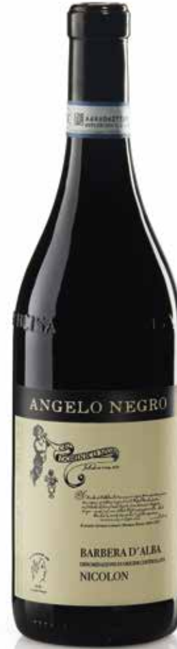
BARBERA D'ALBA DOC NICOLON