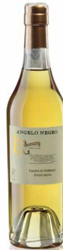
GRAPPA DI NEBBIOLO