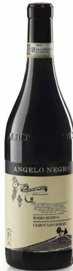
ROERO DOCG RISERVA CIABOT SAN GIORGIO 32 mesi tra botte e bottiglia 32 months between barrel and bottle