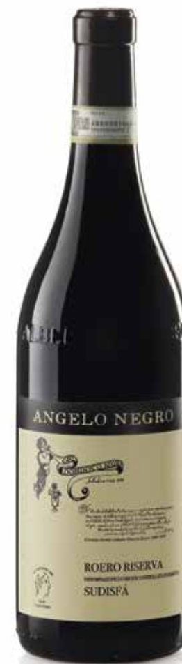
ROERO DOCG RISERVA SUDISFÀ 32 mesi tra botte e bottiglia 32 months between barrel and bottle