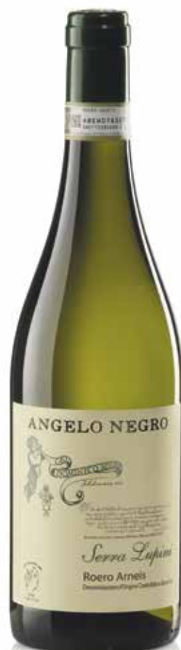
ROERO ARNEIS DOCG SERRA LUPINI