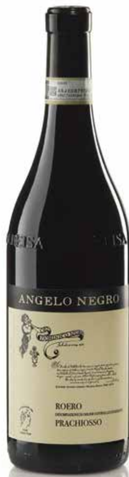
ROERO DOCG PRACHIOSO 20 mesi tra botte e bottiglia 20 months between barrel and bottle