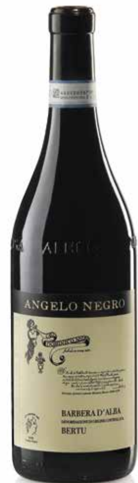
BARBERA D'ALBA DOC BERTU